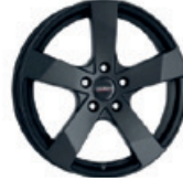
Dezent TD dark