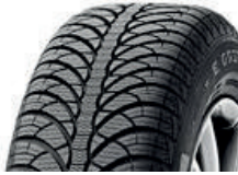
Fulda Kr. Montero