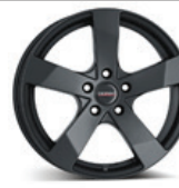
Dezent TD Dark

* Nabídka platí od 1. 9. do 31. 12. 2017 nebo do vyprodání zásob u participujících partnerů Renault. Přezutí zdarma platí při koupi sady 4 ks pneumatik Nokian, Fulda, BFGoodrich, Goodyear, Dunlop nebo Michelin, zahrnuje práci a drobný materiál (ventilky, závaží) kromě případných nákladů spojených s nutností použití čidla pro systém stálé kontroly tlaku v pneumatikách (TPMS). Při koupi sady 4 ks kompletu plechových disků s výše uvedenými značkami pneumatik je platná nabídka ozdobných krytů kol zdarma. Dostupnost a cena disku z lehké slitiny se může lišit dle motorizace Vašeho vozidla. Kompletní nabídku disků získáte u svého prodejce.