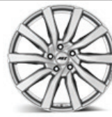
AEZ Reef SI